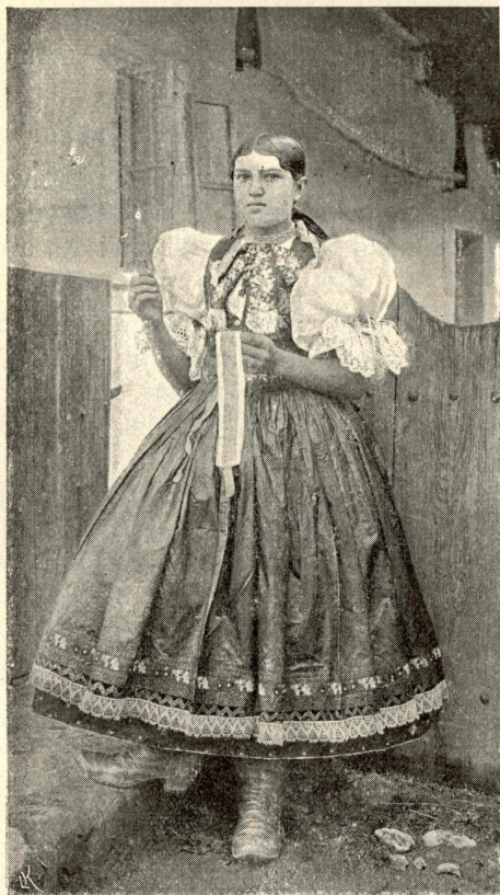
Děvče v Prenčově (Hont).

dová“), tak zvaný plech, barvy tmavší nebo bledší než sukně. V prešpurské stolici nosí bohatší selky až tři „plechy“ nad sebou. Chudá si toho dovoliti nesmí. Ale staré ženy spokojí se též jen jedním „plechem“; někdy stačí též úzká tkanička.