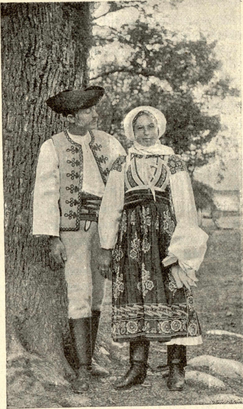
Muž a žena v Osadě (Liptov).

a barvy rozmanité. Šijí se ze sukna domácího hrubého (huněného) nebo z koupeného, někde i z plátna, činovatě, drilichu. Přitahují se k tělu remeňom (opašník). Vpředu od pásu