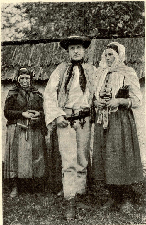
Muž se ženou v Sliáčich (v Liptově).

Pro označení oděvu jako celku lid užívá rozličných výrazů: kroj , ručno , stroj , oblek , oděv , šaty , háby , úbor , nosivo ; pak posměšně: šúchy , gráty , šmaty , lachy . Ony