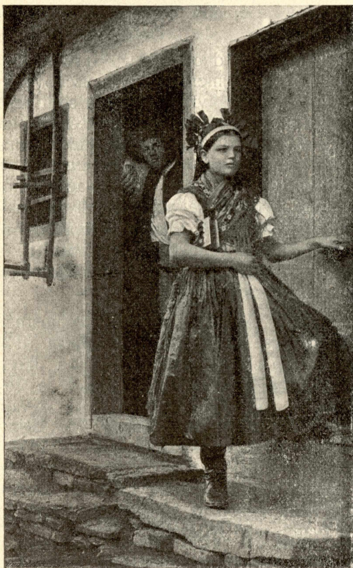
Děvče ve Štvrtku (ve Spiši).

čepec. Vdané ženy, aby jim vlasů nebylo viděti, pečlivě si je zahalují zvláště v tyle. Někde stáčejí si vlasy do pletenic a uvazují na temeni hlavy, ale pravidelným zvykem jest natahovati a otáčeti vlasy na podlohy z rozličných látek a různých tvarů